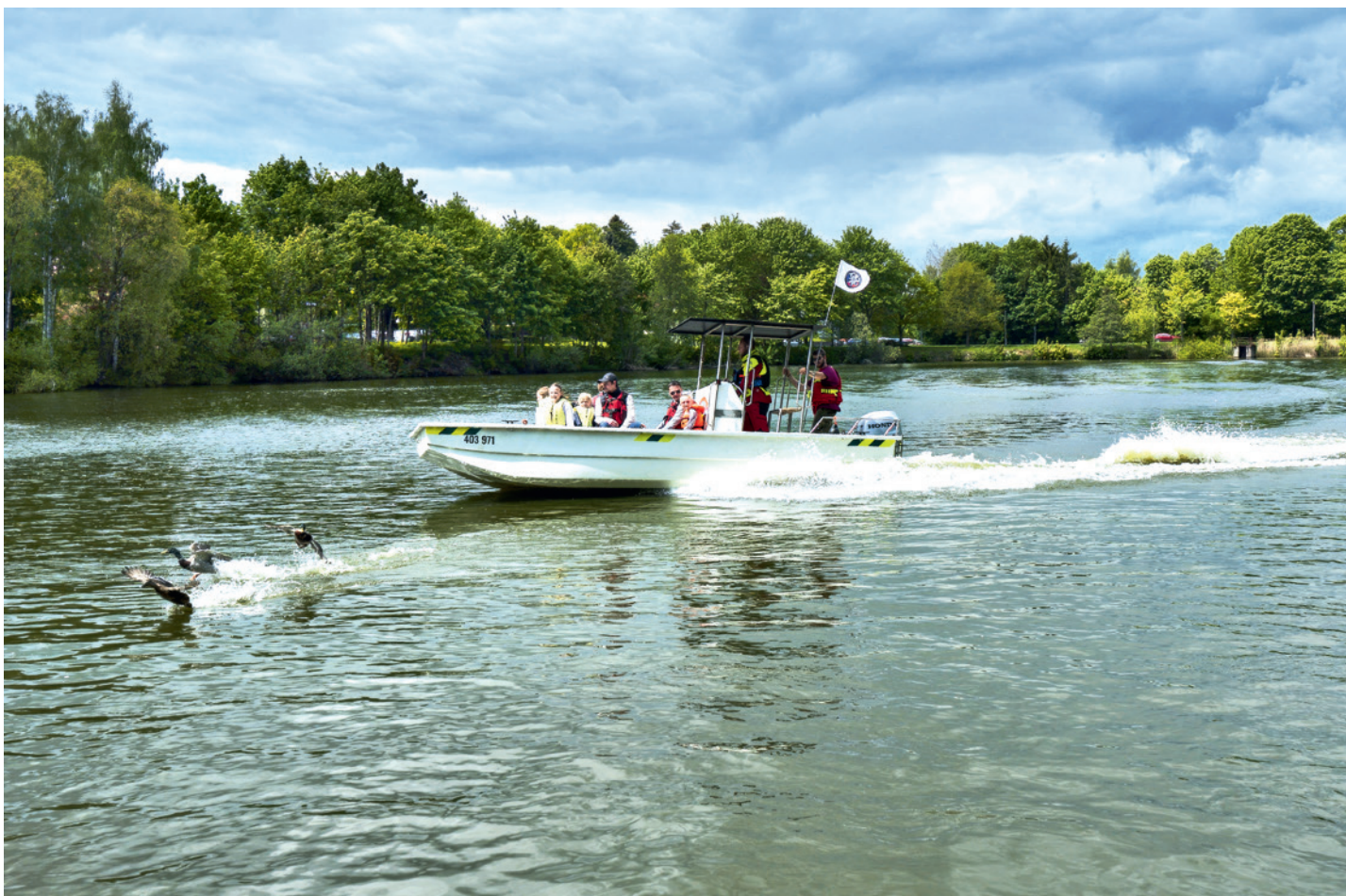
Houkačky Planá 2026