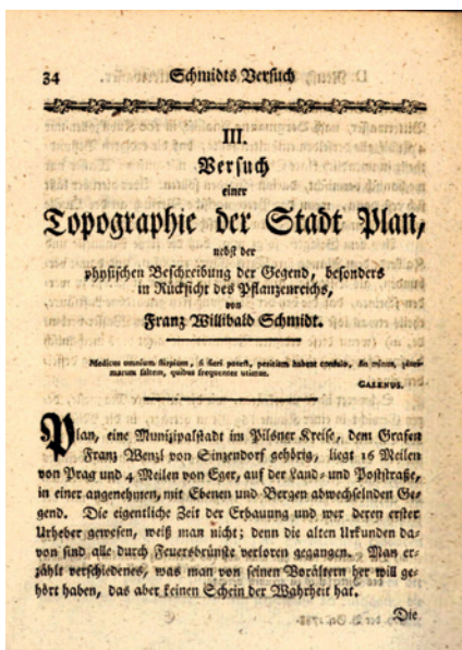
Schmidtovo dílo týkající se Plané.

Schmidt pilně publikoval své vědecké práce ve vědeckých časopisech i samostatně. K jeho stěžejním dílům patří titul Flora Boëmica inchoata exhibens plantarum regni Boëmiæ indigenarum species . Čtyřsvazková publikace vyšla v letech 1793–1794. Jde o jedno z nejstarších ryze botanických děl týkajících se území Čech. Schmid dilo dedikoval císaři Františkovi II. Knihu vydal pražský knihkupec Jan Bohumír Calve na náklady hraběte Canala. Ve stejných letech vyšla zkrácená ilustrovaná verze díla, kterou v Praze vytiskl Antonín Hladký pouze ve dvou exemplářích – jeden byl určen pro hraběte Canala, druhý pro veřejnou a univerzitní knihovnu.