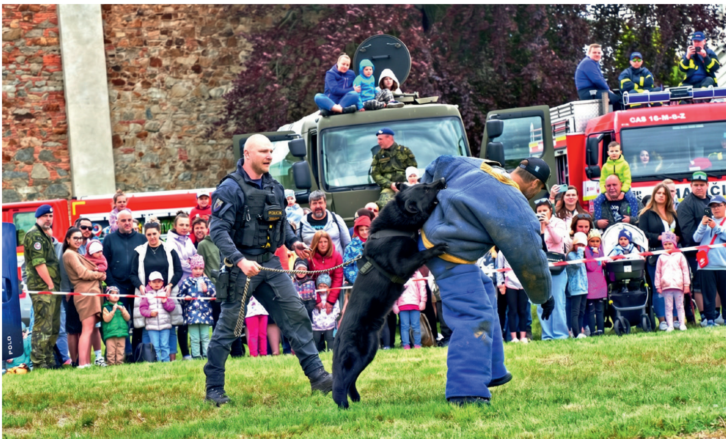
Houkačky Planá 2025.