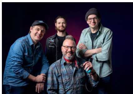
Zdroj: Charlie Slavík revue

V sobotu 16. 5. se uskuteční v Městském parku 2. ročník jedné z největších letošních akcí pro širokou veřejnost HOUKAČKY PLANÁ 2026 . Zábavný den pro celou rodinu nabídne pestrý program pro děti i dospělé, kteří se také dozví spoustu užitečných informací o práci hasičů, zdravotníků, policistů, vojáků, nízkoprahových organizací, skautů atp. Pro děti zahraje od 11 hod. skupina Pískomil se vací. Celý program doprovodí food zóna s pestrou nabídkou jídla i nápojů.