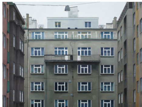
„Letná“, 2012, olej na plátně, 90x120 cm

Hlavní témata její práce se týkají společenských a rodinných rituálů, dětství, vztahů mezi blízkými lidmi, ale i samoty a osamění. Ivana Lomová vytváří tematické cykly – např. Muži a ženy, Dětství, Čas, Noc, Ráj, Samota, Kavárny, Cestující - které většinou vystavuje samostatně. My budeme mít však možnost zhlédnout výběr z několika cyklů. Při práci Ivana Lomová používá vlastní fotografické předlohy, které však malířskou cestou transponuje tak, že vytvořený obraz se noří hlouběji než fotografie, a odkrývá nám tak jistou tajemnost, která nás v našich životech obklopuje.