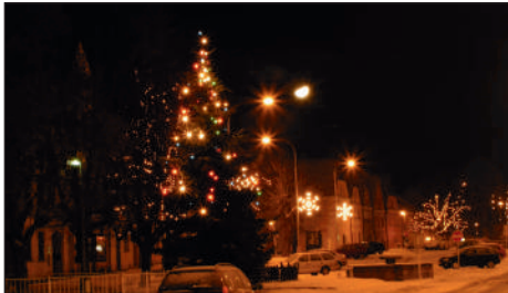
Vánoční strom na vyzdobeném náměstí se sněhem v r. 2010.

Podobně jako v jiných městech máme i u nás v Plané první adventní akci Rozsvícení vánočního stromu. Ta se koná v neděli 30. listopadu od 17 hodin.