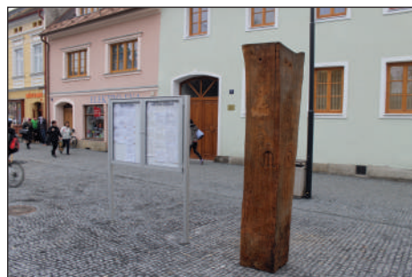
Skulpturu z dubového dřeva vytvořil plánský sochař J. H. Mácha.