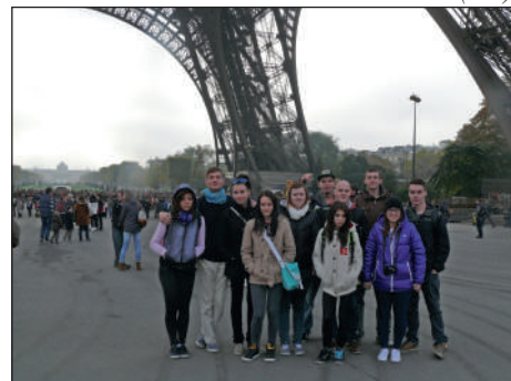
Žáci učiliště u Eiffelovy věže.