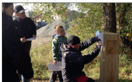
Na otevření stezky si lidé zahráli interaktivní hru s tajenkou.

spolufinancována Evropským zemědělským fondem pro rozvoj venkova. (KOS Planá)