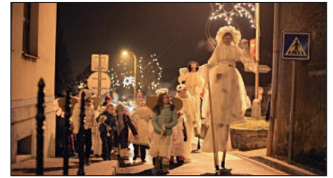
Výlet andělů 2013.

v pondělí 22. prosince do kostela sv. Petra a Pavla v rámci akce Výlet andělů. Průvod vychází v 16.30 od kostela Nanebevzetí Panny Marie.