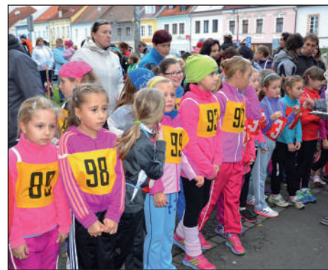
Start jedné z prvních kategorií se konal ještě za světla.