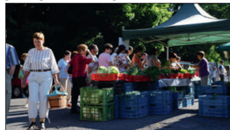
Takto navštěvované bývaly trhy první rok.

nejbližším okruhu místa svého působení. Jaký vývoj bude v nejbližší době následovat, to ukáže až čas. Ale třeba budeme příjemně překvapeni,“ dodává pořadatel. (red)