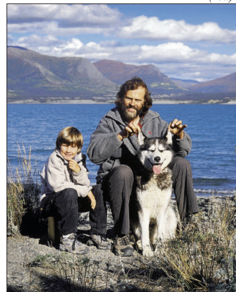
Fotografie z cestovatelovy nové knihy.