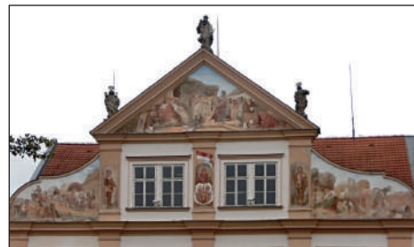
Dnešní podoba radnice s freskami.