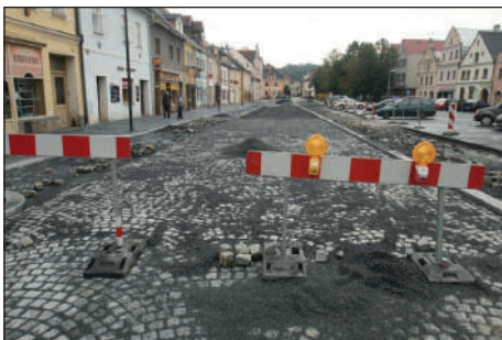
Stav náměstí v polovině září.