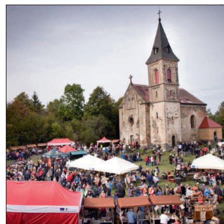
Loni se na slavnostech sešlo přes 3,5 tisíce lidí.

menu a Rodinný pivovar Chodovar připraví již po několikáté jablečné pivo,“ dodává Jan Florian.