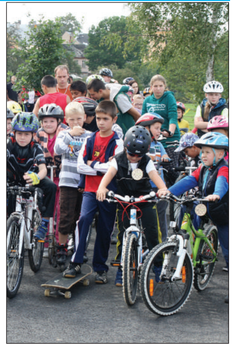
Na startu oficiálního otevření nového městského parku se sešlo kolem stovky aktivních účastníků.

Budoucnost parku je otevřená i dalším projektům. „Mohlo by se tu časem vybudovat například i venkovní fitness hřiště, které by sloužilo nejen seniorům, ale i ostatním občanům,“ dodala starostka. (red)