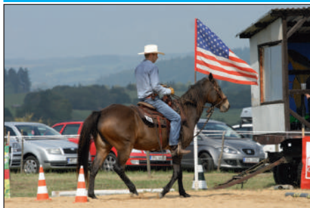
V sobotu 6. září mohli všichni milovníci koní zavítat na ranč Kříženec, kde se uskutečnily Kříženecké hobby závody v nejrůznějších disciplínách.