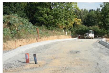
Aktuální průběh výstavby nové ulice na severu Plané ze dne 20. září.