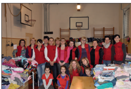
Burzateam uspořádal v Plané již řadu akcí.

„Velký dík patří nejen všem maminkám, které se na akci podílejí, ale také základní škole Na Valech a plánskému odbornému učilišti za zajištění cateringu. Všem ostatním děkujeme za obrovský zájem,“ dodává pořadatelka s úsměvem. (red)