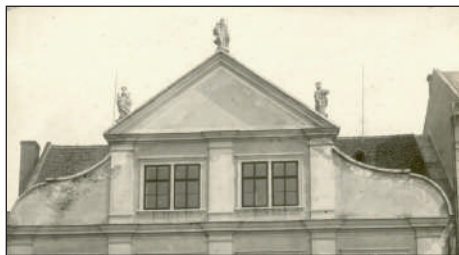
Takto vypadala radnice původně.