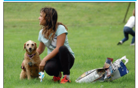
V sobotu 13. září se na kynologickém cvičišti v Plané konal 15. ročník soutěže O nejhezčího voříška. Vítězkou se stala fenka křížence Deny.