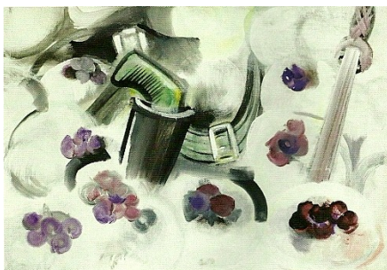
Policejní zátiší – borůvkové knedlíky

Prof. Dr. Vladimír Franz je přední český hudební skladatel, výtvarník, vysokoškolský pedagog a také příležitostný publicista, básník a dramatik. Od počátku 80. let skládá scénickou hudbu, za níž získal řadu ocenění, věnuje se rovněž volné hudební tvorbě a kompozici hudby filmové, televizní a rozhlasové. Druhou oblastí jeho umělecké činnosti je tvorba výtvarná. A právě tuto tvorbu, malířské dílo, vystaví Galerie ve věži od 8. června do 16. července 2014.