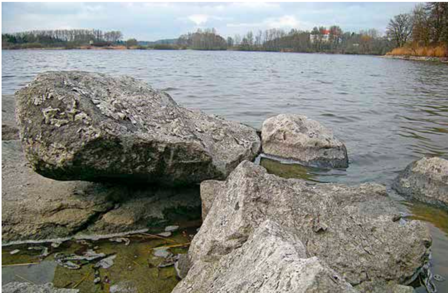
Labutí rybník.

Ročník 28 • Číslo 3 • Březen 2018 • Cena 2 Kč