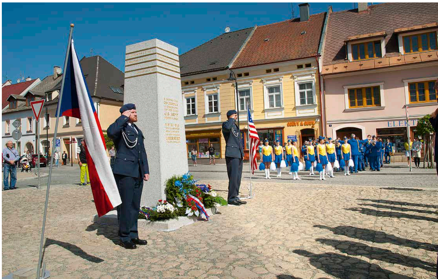
Snímek z květinového odhalení nového památníku na náměstí Svobody.

Ročník 28 • Číslo 6 • Červen 2018 • Cena 2 Kč