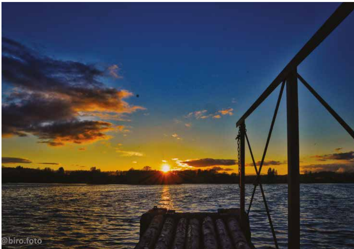
Anenský rybník; Foto: Eliška Biroščáková

Ročník 30 • Číslo 09 • Září 2020 • ZDARMA