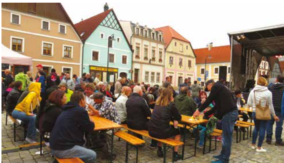
Posvícení na Václava 2019