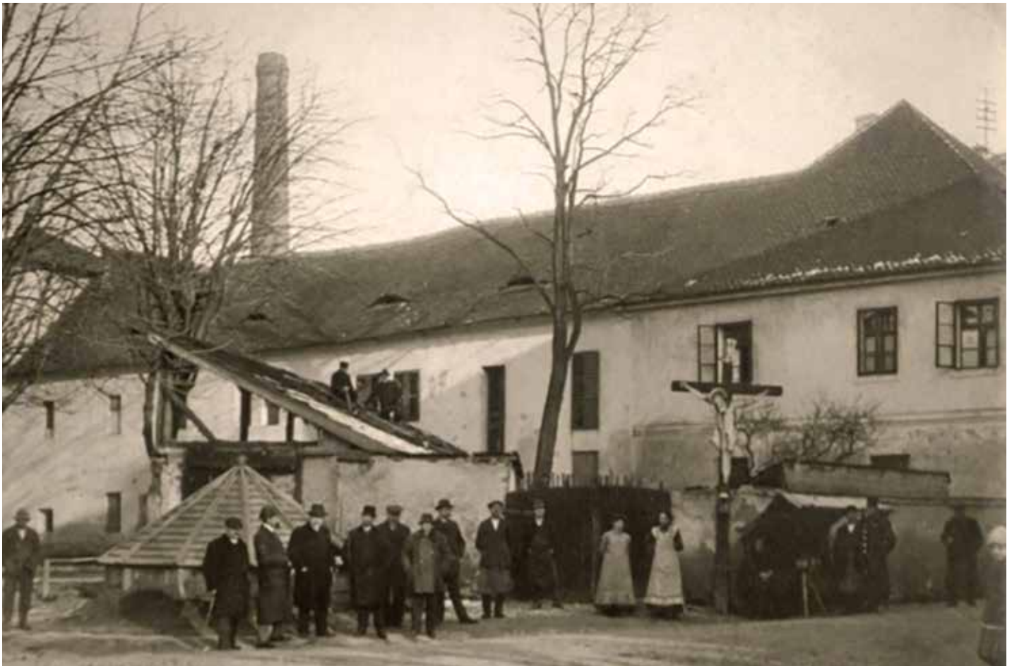
Mincovna kolem roku 1900

Ročník 30 • Číslo 11 • Listopad 2020 • ZDARMA