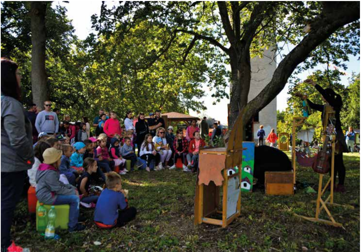
111 let rozhledny

Ročník 30 • Číslo 10 • Říjen 2020 • ZDARMA