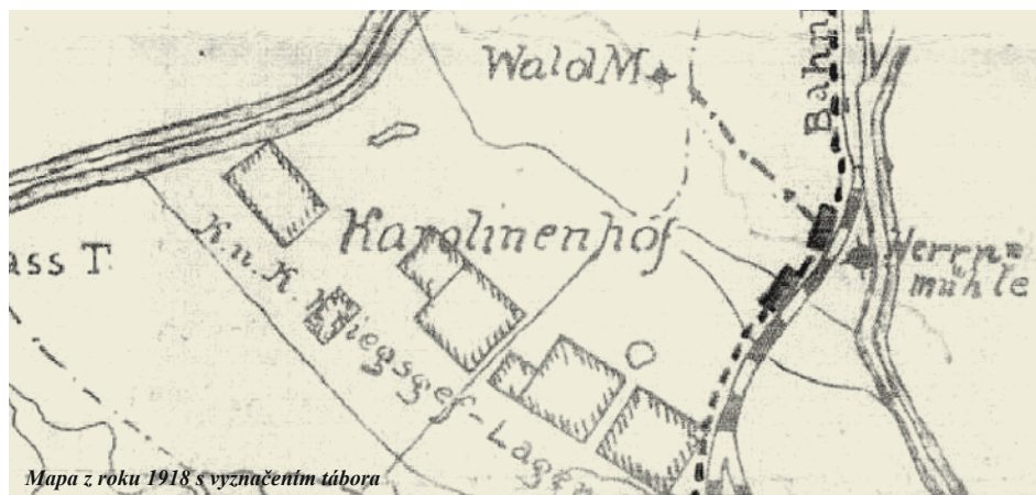
Mapa z roku 1918 s vyznačením tábora