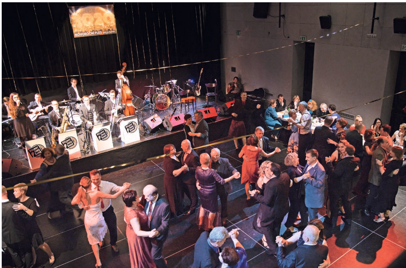
11. 1. Novoroční ples města Planá.

Ročník 30 • Číslo 02 • Únor 2020 • Cena 2 Kč