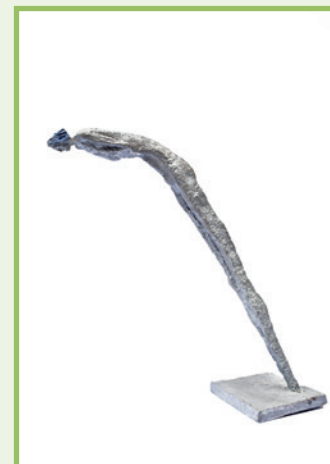
Olbram Zoubek, Akt ženy