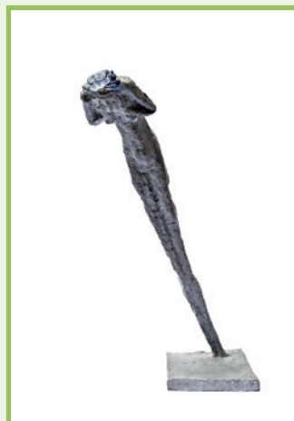
Olbram Zoubek, Akt ženy

V lednu 1969 se rozhodl prokázat poslední službu Janu Palachovi a sejmul mu posmrtnou masku. 1. června 1970 navíc na hrob Jana Palacha položili bronzovou náhrobní desku s Janovým reliéfem. Záhy nato však deska z hrobu zmizela, byla rozřezána a roztavena.