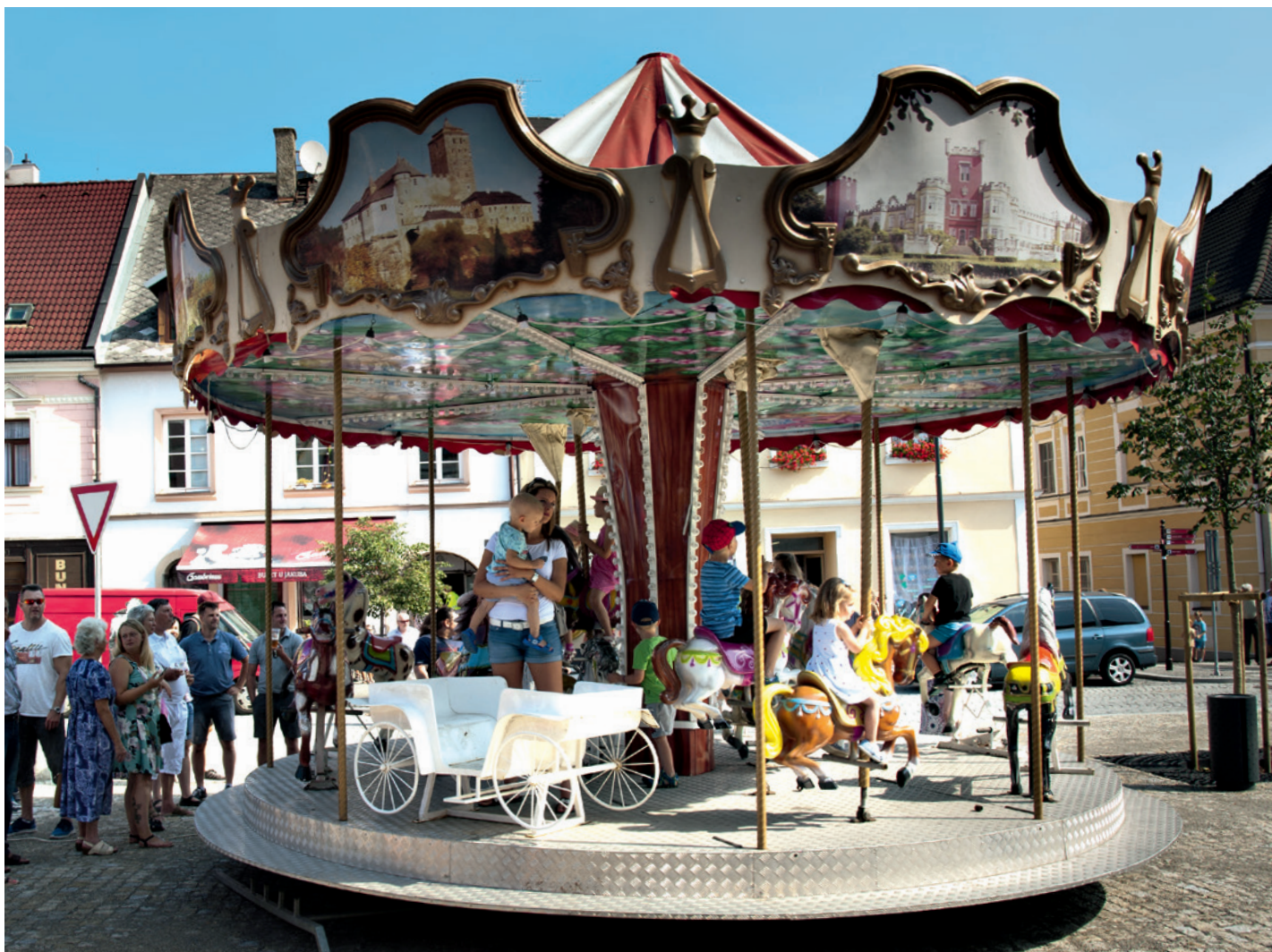
Anenská pouť 2018.

Ročník 32 • Číslo 8 • Srpen 2022 • ZDARMA