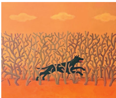
Michal Tomek Psi běh I., 2015, olej, plátno