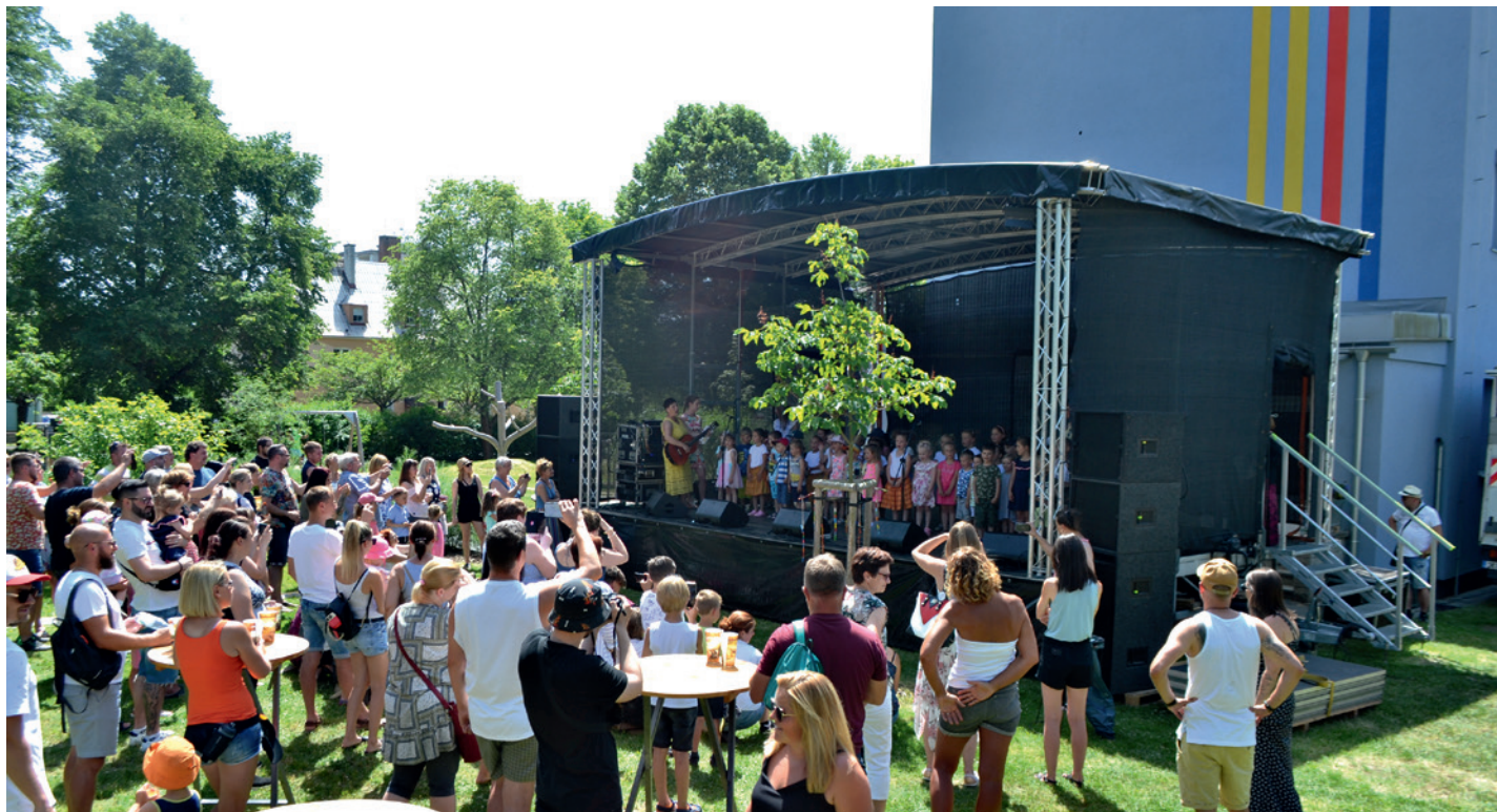
Zahradní slavnost a den otevřených dveří v MŠ 18. 6. 2022.

Začalo to školními výlety. V tomto školním roce jsme se všichni vypravili do ZOO Plzeň. Počasí nám přálo, a tak jsme si návštěvu u zvířátek užili. 1. června jsme oslavili den dětí. Na zahradách obou školek jsme pro děti připravili soutěže a nechybělo opékání buřtů. Slunečný den, dobrá nálada, oběd na zahradě – vše, co k oslavě patří. Další týden v úterý ráno přišlo a přišlo. Bohužel všichni předškoláci, natěšení na výlet do lesa, byli smutní. Promočený les jsme nenavštívili. Druhý den měly děti z MŠ Smetanova štěstí a do lesa vyrazily. Poznávací výlet se vydařil a děti byly nadšené. V MŠ Havlíčkova jsme pro tatínky připravili malou oslavu ke dni otců. Je pravda, že tatínkové tento svátek neslaví. Pro maminky míváme setkání ve třídách, zpívá se, vyrábí... Tatínkům to bylo líto, tak jsme se rozhodli to napravit. Odpoledne na zahradě bylo prima. Děti s tatínky vyzkoušeli velkou skluzavku, tačkové své děti vozili v kolečku, děti vozily malé kolečko s míči, prostě se běhalo jako o závod a on to závod byl. Na všechny čekala odměna a na závěr se opékaly buřty. Děti si své tačky opravdu