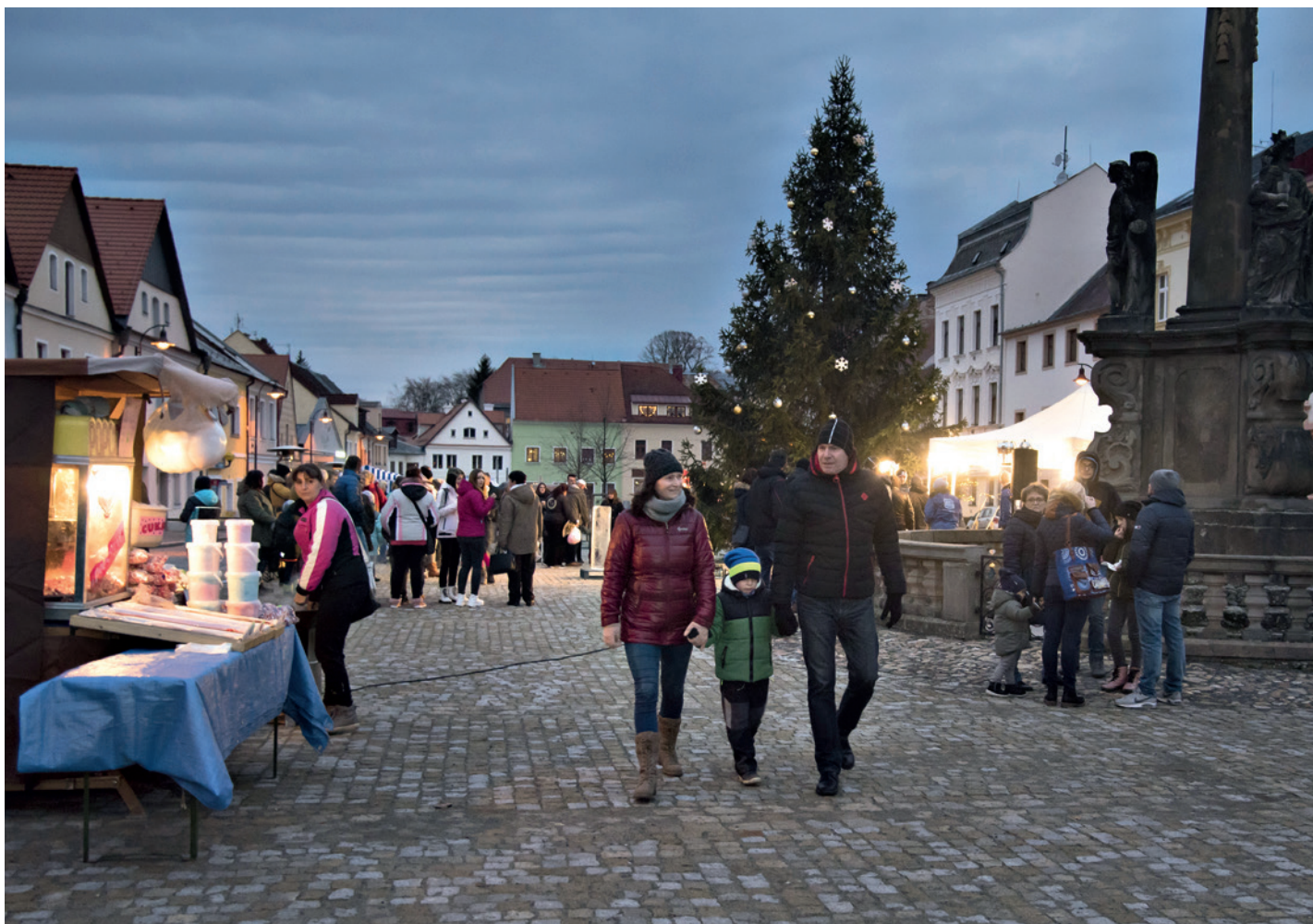
Slavnostní rozsvícení vánočního stromu 2019.

Ročník 32 • Číslo 11 • Listopad 2022 • ZDARMA