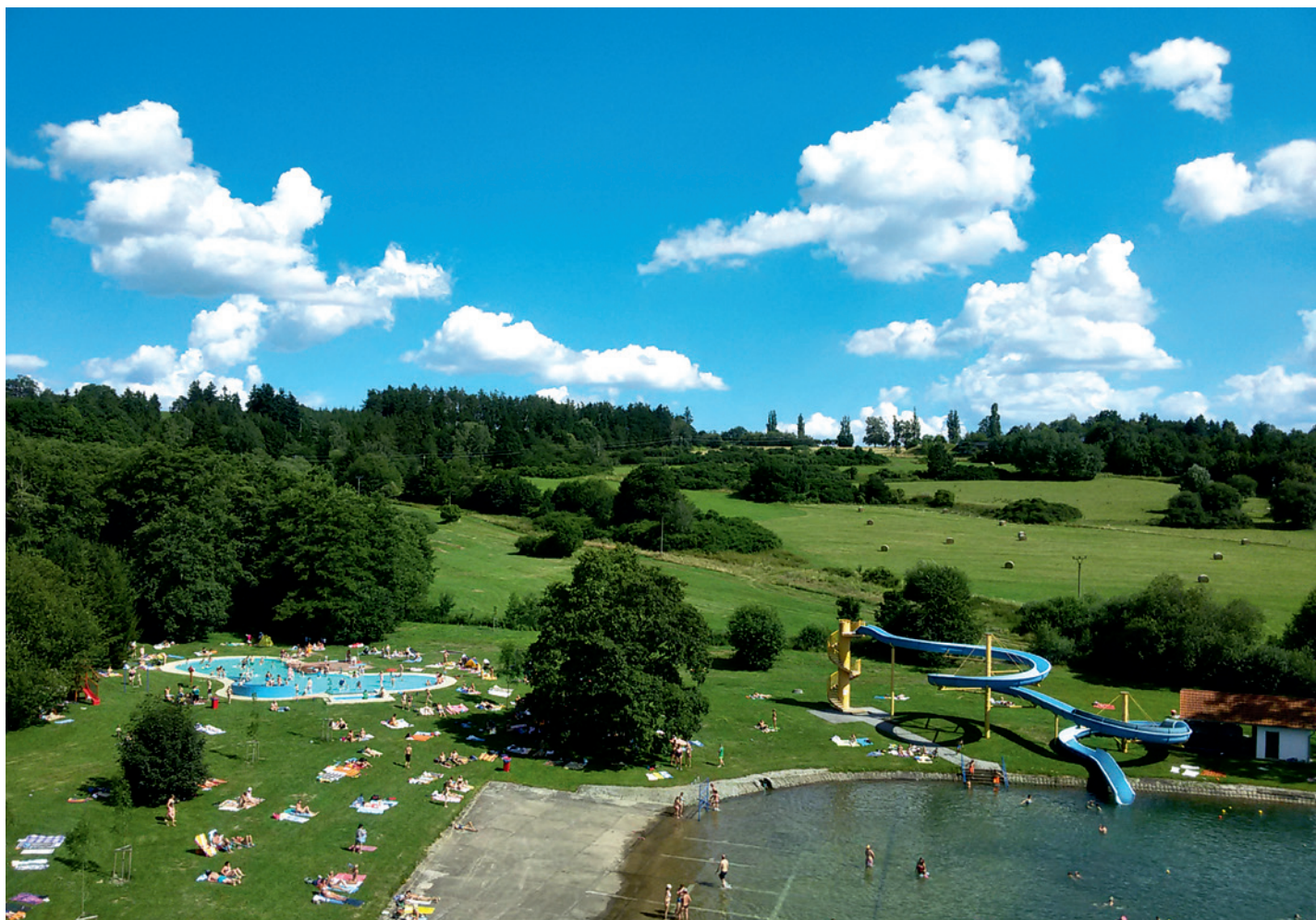
Plánské koupaliště.

Ročník 32 • Číslo 7 • Červenec 2022 • ZDARMA