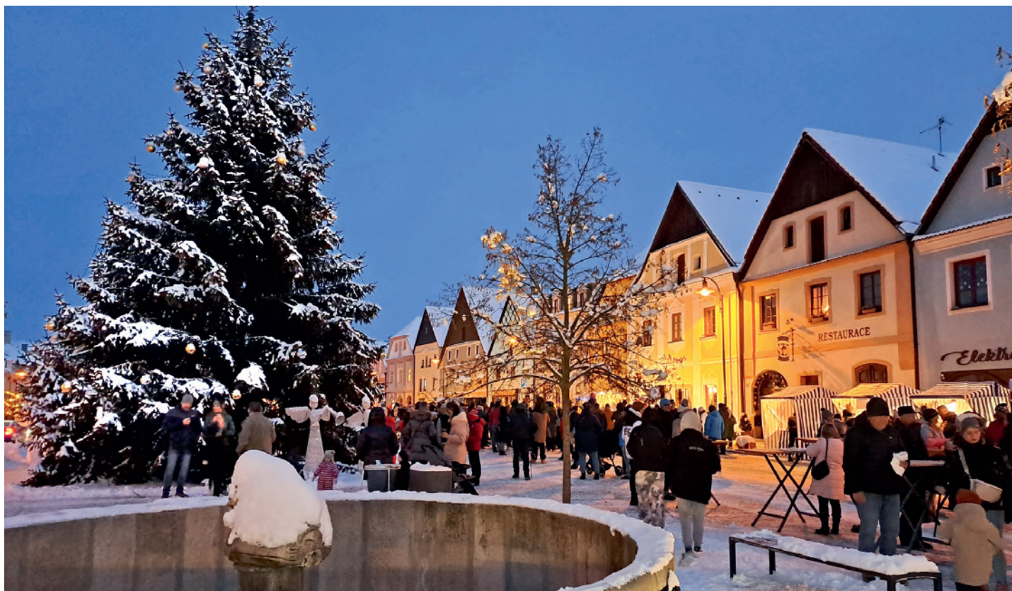
Rozsvícení vánočního stromu 2023.