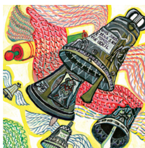
Ilustrace z knihy Velikonoční knížka

Městská knihovna Planá se již poněkoliakrát připojuje k projektu Noc s Andersenem. Noc s Andersenem je akce, kterou pořádají knihovny u příležitosti narození dánského spisovatele pohádek Hanse Christiana Andersena a jež připadá na 2. dubna. První noc s Andersenem se konala v roce 2000 v uherskohradištské knihovně, během které si děti mohly hrát různé hry, soutěžit a číst. Roku 2001 se pod záštitou Klubu dětských knihoven pořádala Noc s Andersenem ve 40 knihovnách v České republice. V roce 2002 pořádalo Noc s Andersenem více než 70 míst v České republice, a to nejen knihovny, ale už i školy, školky či domovy dětí, a v tomto roce se poprvé účastnila Noci s Andersenem i Krajská knižnice v Trnavě. Již mezinárodní Noc s Andersenem se konala roku 2003, kdy proběhla ve 151 knihovnách, školách i domech dětí v České republice, v 7 knihovnách na Slovensku a v 5 polských bibliotékách. Informace o Noci se dostaly na Aljašku, do Švédska, Švýcarska i Spojených států.