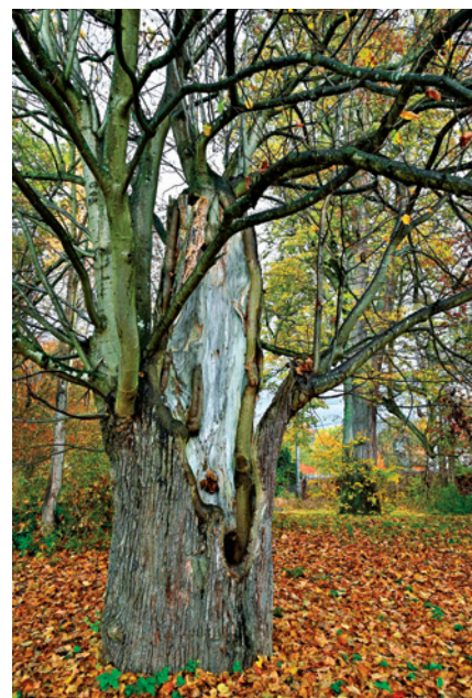
Torzo lípy velkolisté severně od zámku.