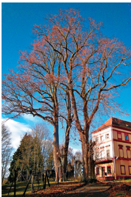
Dvojice stojících lip a pahýl třetí lípy před zámekem.