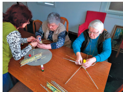
Velikonoční tvoření.

Simona Peteříková, vedoucí pečovatelské služby