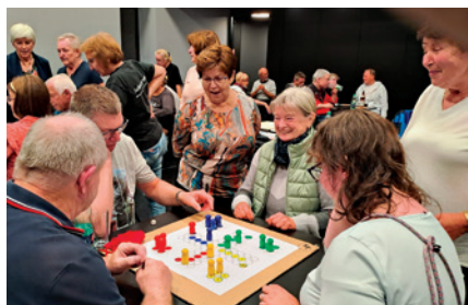
Turnaj ve hře Člověče nezlob se.

V roce 2023 naše organizace Svazu tělesně postižených připravila pro své členy opět mnoho činností. Každý měsíc se scházeli členové výboru, kdy plánovali další akce a projednávali důležité záležitosti týkající se chodu naší organizace. Nabídka činností byla velice pestrá. Každý měsíc se něco dělo. Členové mohli například navštívit divadlo v Plzni, různé jednodenní výlety, vícedenní ozdravné pobyty. Velice úspěšný byl ozdravný a poznávací pobyt v Karlových Varech v hotelu Morava. Osvědčil se i pobyt v Sezimově Ústí, kam jezdíme již několik let a kde je stále co poznávat. Ve spolupráci s MO Tachov jsme navštívili hotel Praha ve Františkových Lázních. Týdenní pobyt na Slovensku s každodenním výletem do Polska byl suprový. Protože se rádi bavíme, jezdíme na taneční odpoledne nebo večery (Holýšov, Stribro, Černošín). I doma si rádi zatančíme a pobavíme se v našem KINĚNEKINĚ. Navštěvujeme též zámky a hrady v blízkém okolí a různé akce na těchto zámcích. V dubnu