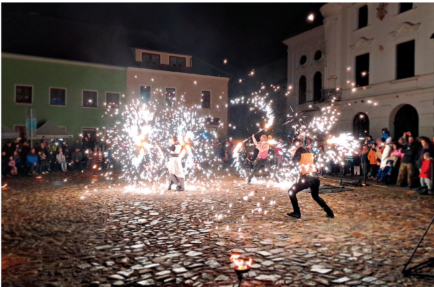
Přivítání nového roku v Plané.