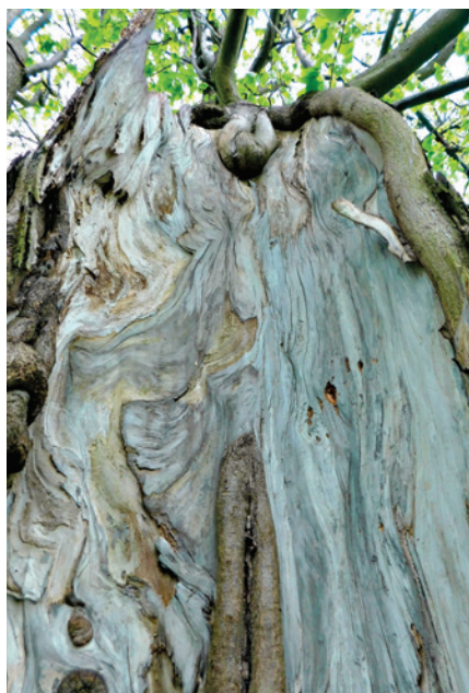
Architektura vnitřku dutiny pahýlu lípy velkolisté severně od zámku.