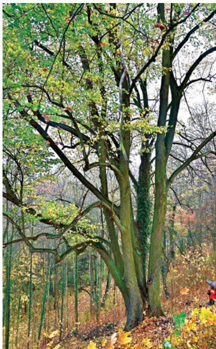
Čtyřkmenná lípa velkolistá.