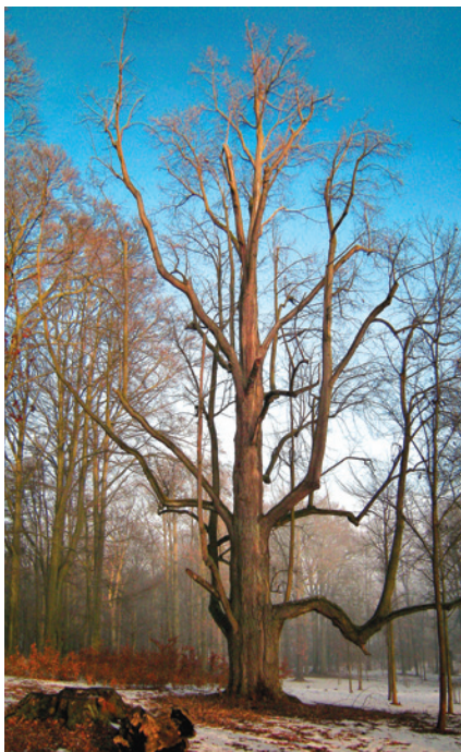
Největší lípa v zámeckém parku před ořezem na torzo.