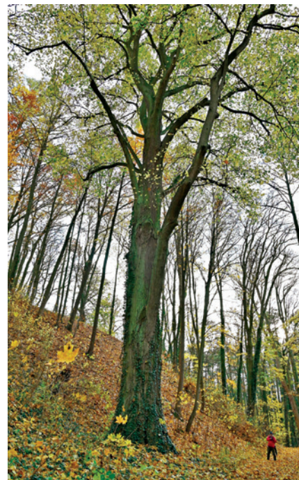
Nejvyšší lípa (velkolistá) v zámeckém parku.