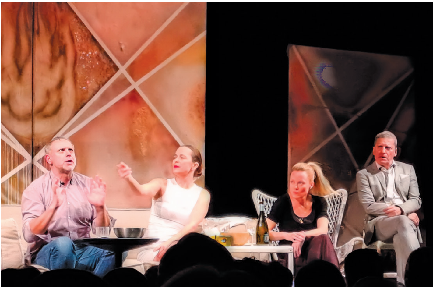
Představení Tři verze života divadla Verze v Kíněnekíně 21. února.