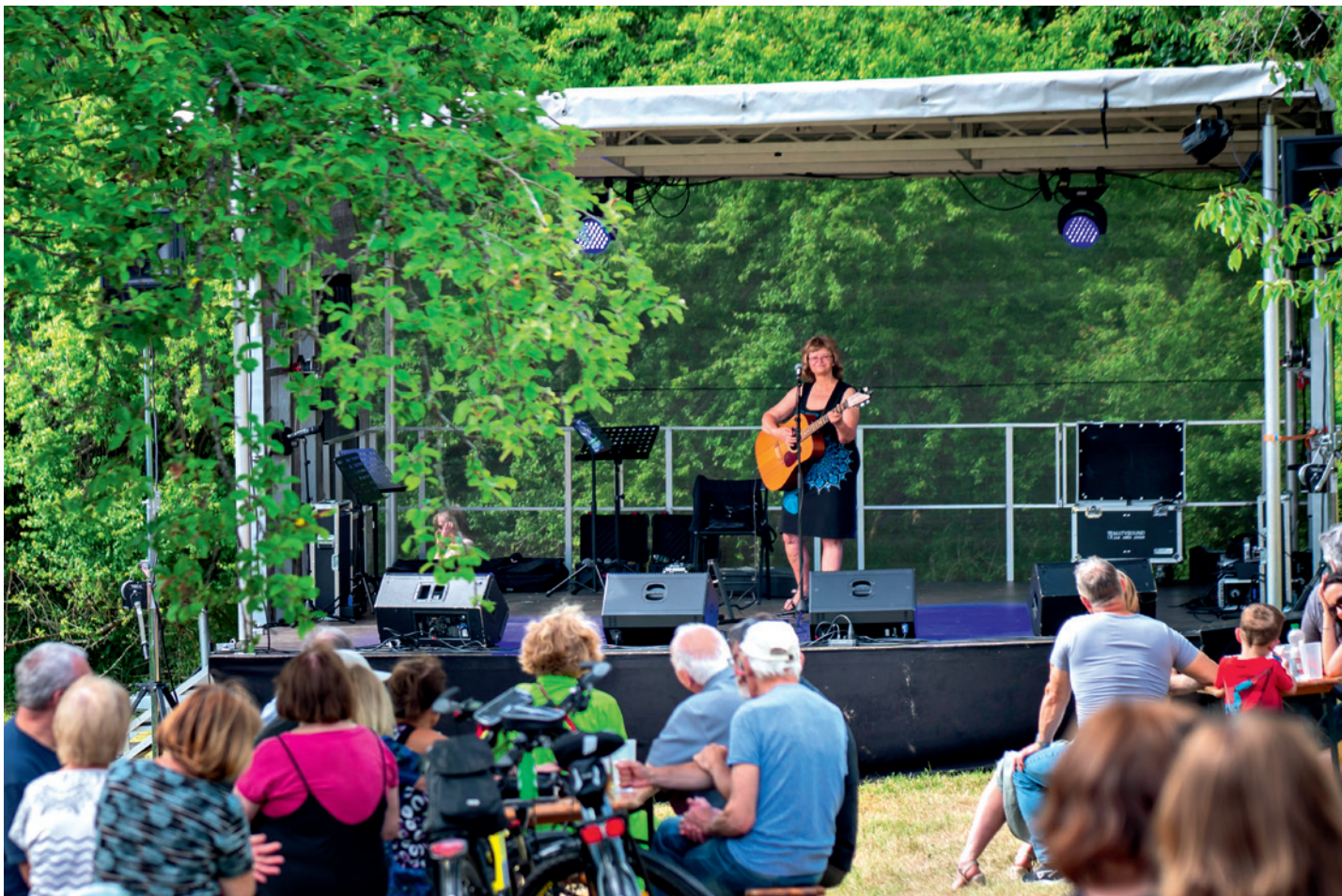
Festival třešni 2024.