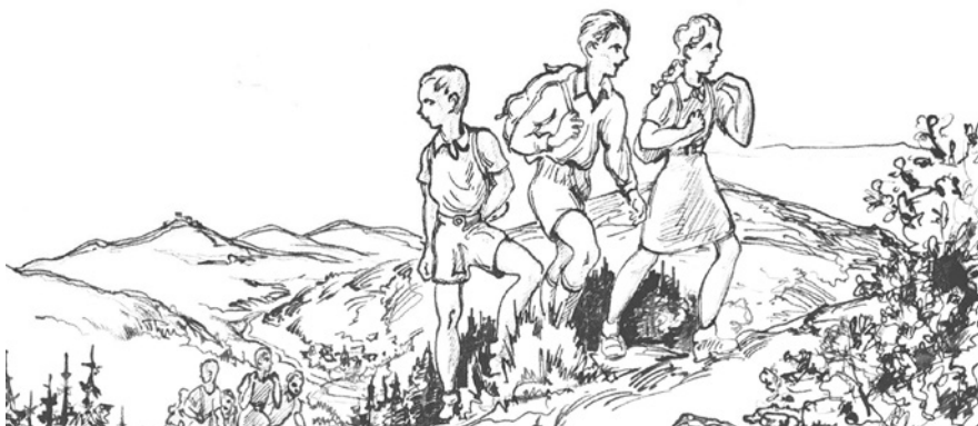
Kresba Franze Wurtingera. Zdroj: Heimatkreis Plan – Weseritz