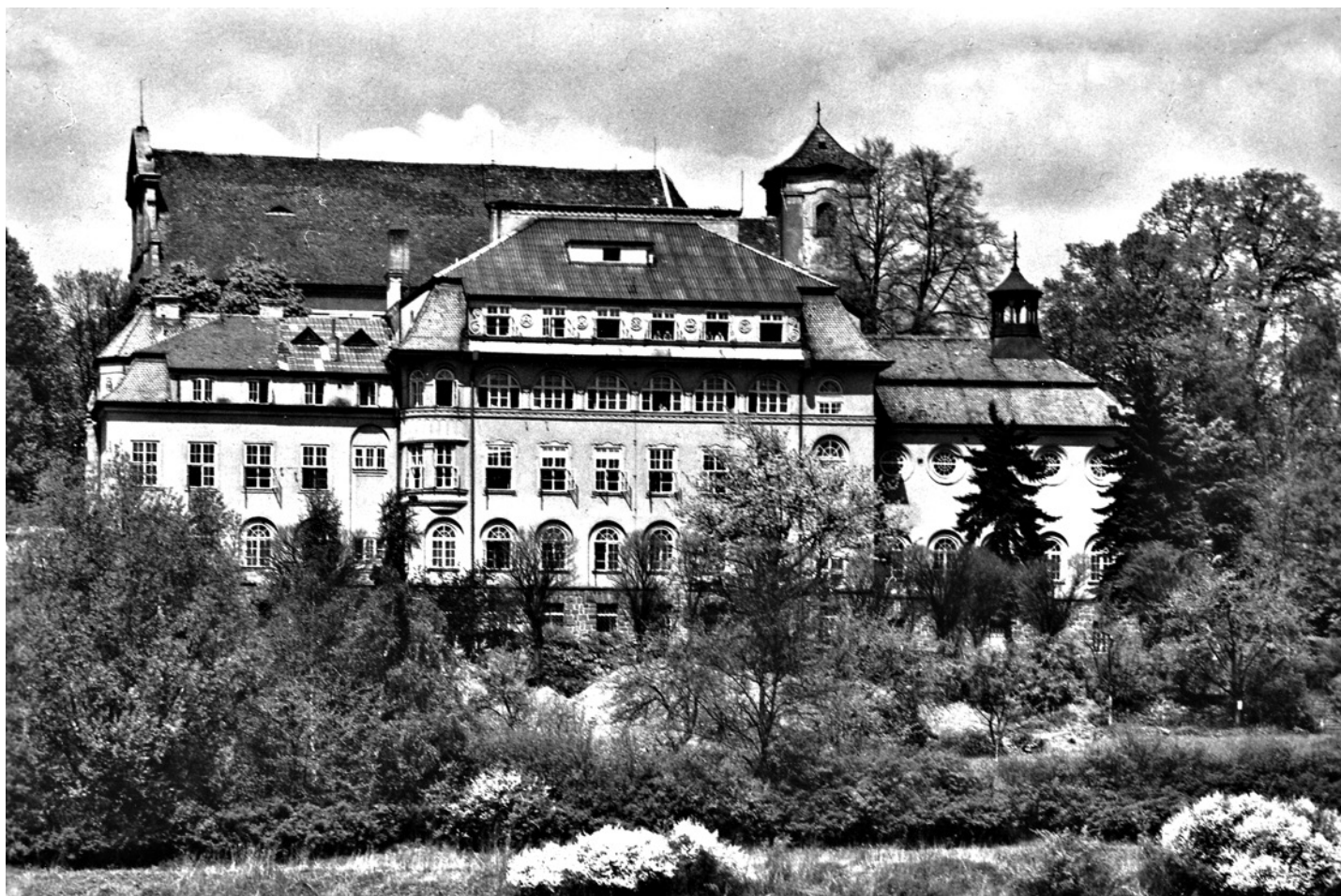
Nemocnice následné péče sv. Anna. Pohlednice vydaná v 1. polovině 70. let.