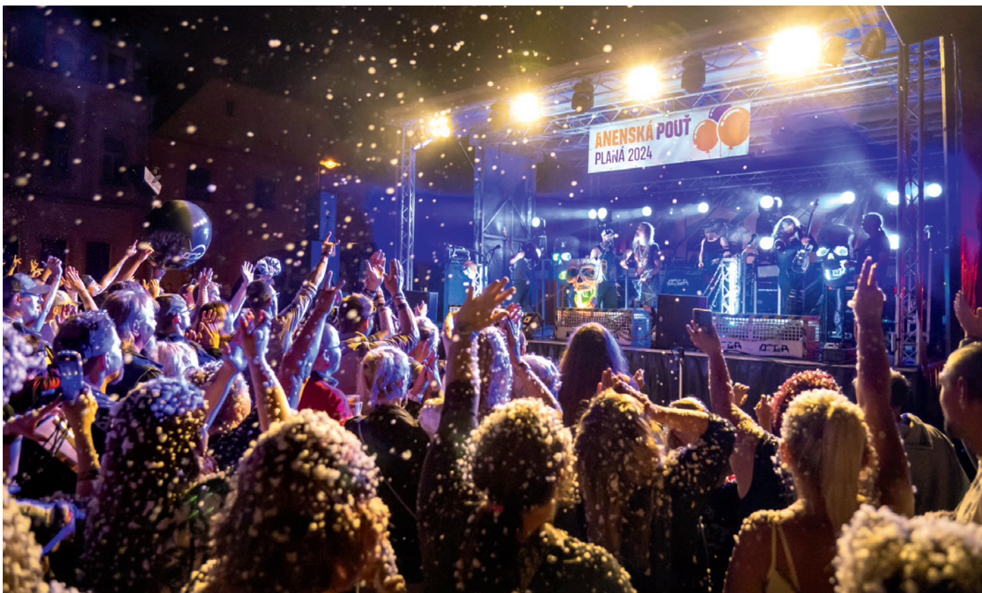
Anenská pouť 27. 7. 2024.

— strana 2 Volby do zastupitelstev krajů